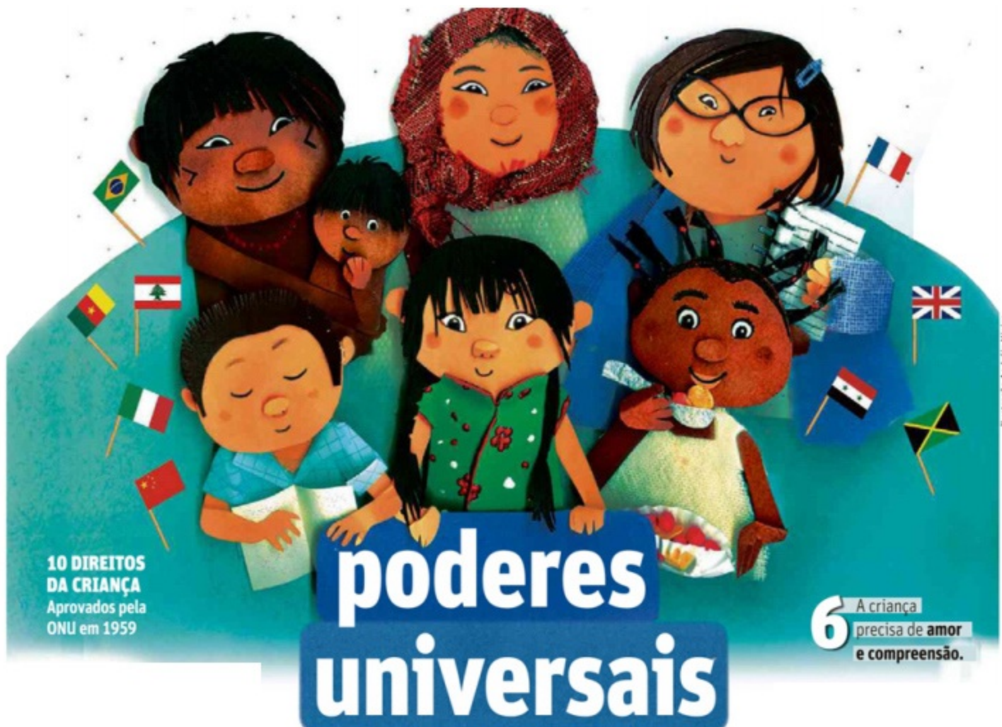
Ilustração: Andréia Vieira

10 DIREITOS DA CRIANÇA Aprovados pela ONU em 1959