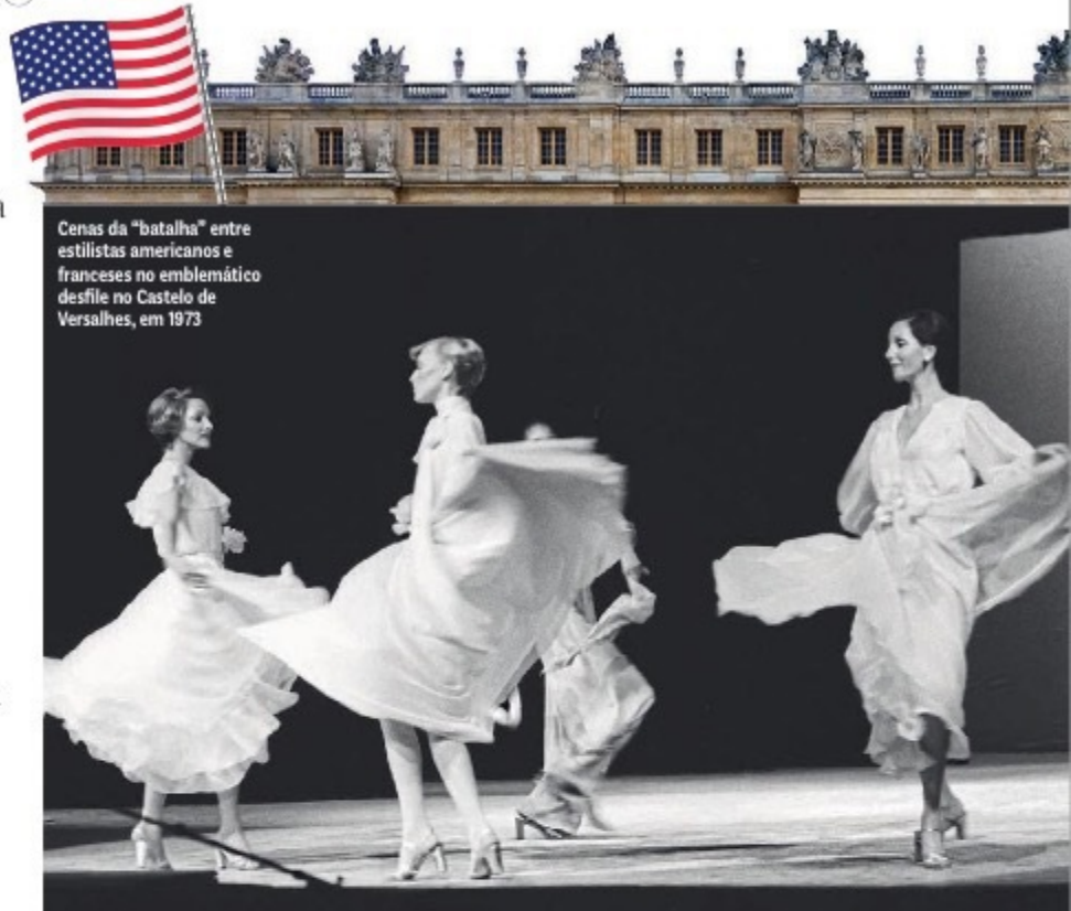
Cenas da "batalha" entre estilistas americanos e franceses no emblemático desfile no Castelo de Versalhes, em 1973

Embora se tratasse de um evento benemerente, batalha é um nome bastante apropriado para descrever as loucuras que o antecederam, a começar pela guerra de egos deflagrada pelos estilistas