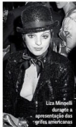
Liza Minnelli durante a apresentação das grifes americanas

escolhidos para representar os dois países. A bancada americana misturava nomes consagrados como Oscar de la Renta, Bill Blass e Halston à musa do sportswear Anne Klein, única mulher do grupo,