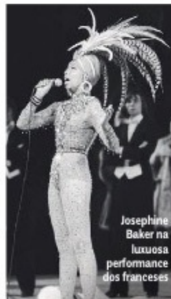
Josephine Baker na luxuosa performance dos franceses

Golpe fatal: os americanos recrutaram um time de